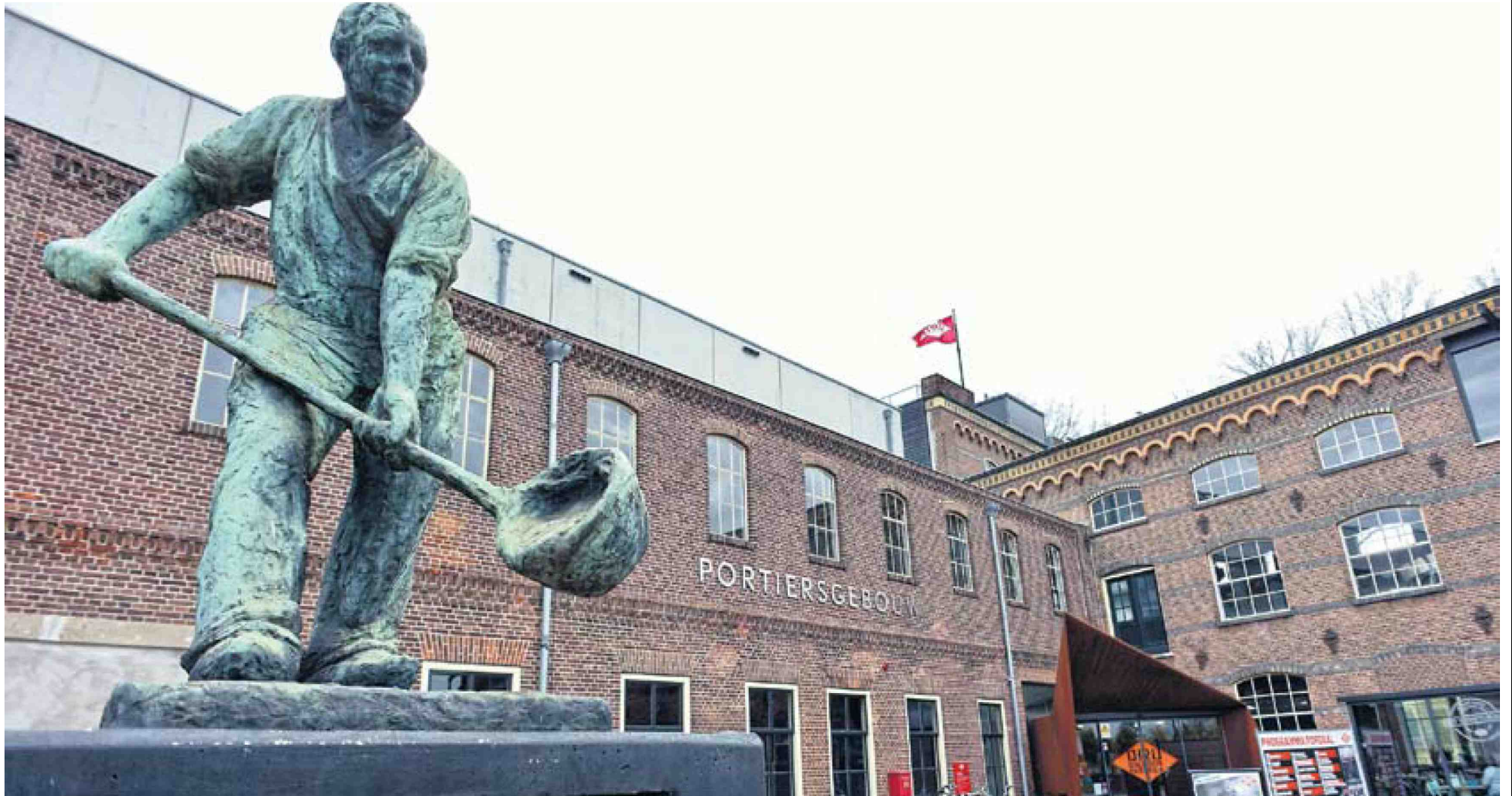
Vroeger werd er ijzer gesmolten, nu is de in 1973 gesloten ijzergieterij van DRU in Ulft een smeltkroes van bedrijvigheid, recreatie en culturele activiteiten.